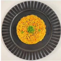
①カレーチャーハン